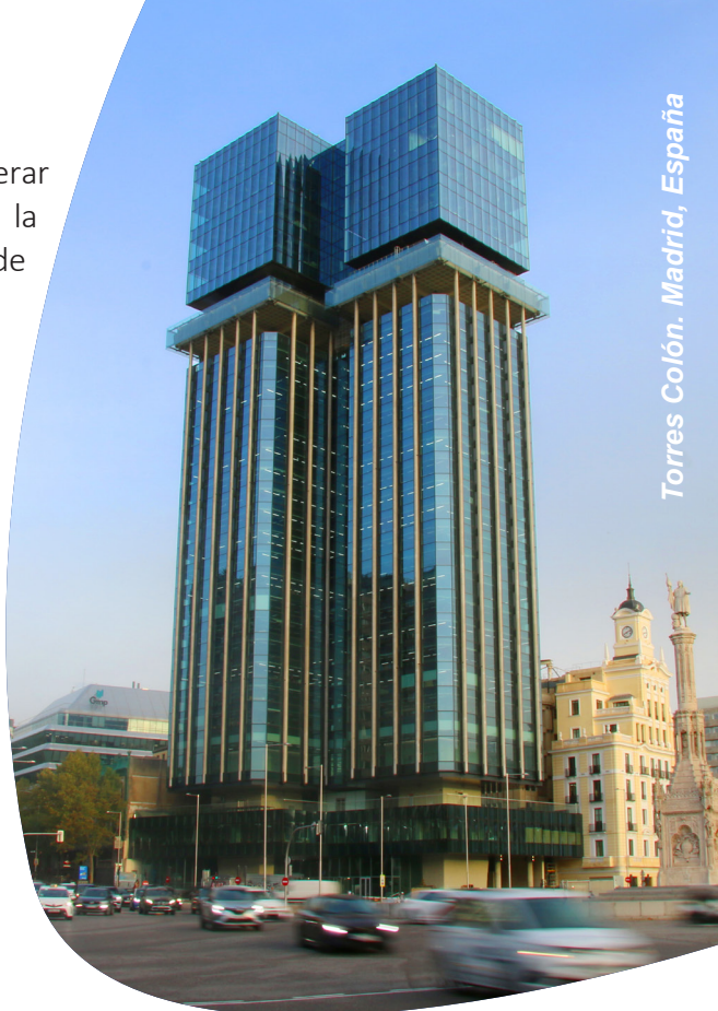
Torres Colón. Madrid, España

Los Socios Comerciales deberán garantizar el cumplimiento de la normativa fiscal vigente en cada país o territorio donde estén presentes, evitando la ocultación de información relevante, la elusión ilegal del pago de impuestos, la obtención de beneficios fiscales indebidos, la obstrucción de la acción de comprobación de las administraciones, o el falseamiento de la información contable o financiera. Igualmente, los Socios Comerciales colaborarán con las Administraciones Tributarias para proveer la información fiscal requerida de acuerdo con la legislación vigente.