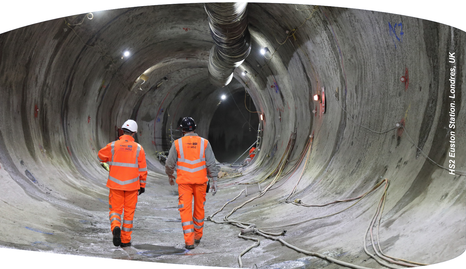
HS2 Euston Station. Londres, UK

Se espera de los Socios Comerciales que dispongan de Modelos de organización y gestión alineados con las buenas prácticas y estándares internacionales que permitan cumplir con los principios de este Código, como puedan ser, con la ISO 45001 sobre Sistemas de gestión de la Seguridad y Salud en el Trabajo.