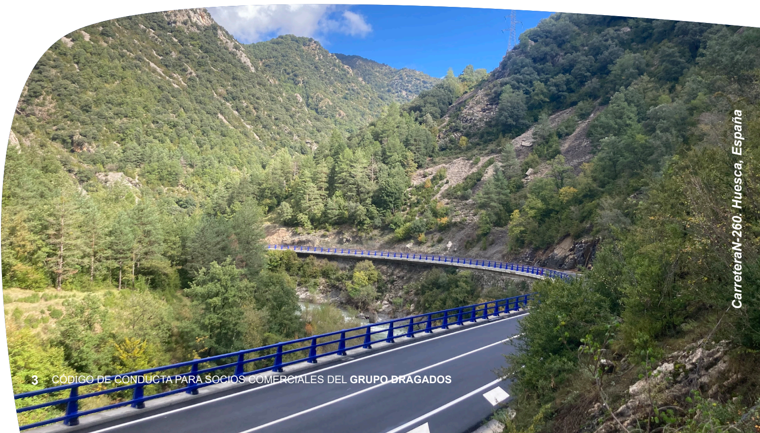
Carretera N-260. Huesca, España

Grupo DRAGADOS promueve la colaboración constructiva con aquellos grupos de interés o partes interesadas que puedan afectar o verse afectadas por la actividad del Grupo y de sus Socios Comerciales, con el objetivo de establecer vías de comunicación, consulta y contactos que contribuyan al mejor desempeño del Grupo y de sus Socios Comerciales en materia de sostenibilidad (en adelante “ Grupos de interés ” o “ Partes interesadas ”).